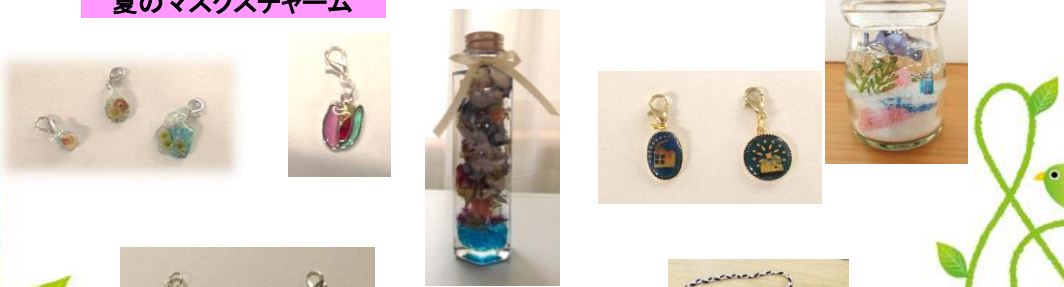
お友達の誕生日 プレゼント♪