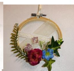
カレードフレーム プレゼントにもイいですね