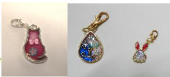
人気のフレームレジンチャーム